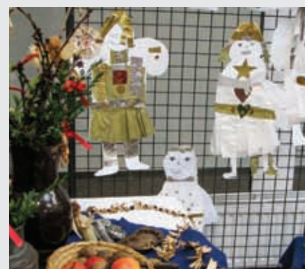
Foto: Děti ze ZŠ se svými učitelkami připravily krásnou výstavu, kterou si můžete v obecní knihovně prohlédnout ještě do 15. ledna 2016.